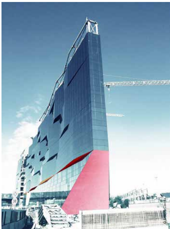
Roma, Nuova sede Gruppo BNL-BNP Paribas Real Estate, immagine di studio / Rome, New BNL-BNP Paribas Real Estate Group headquarter, image studio