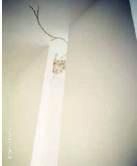
Casa delle Rose, riqualificazione di un interno genovese, Progetto Antonio Lagorio / Rose house, redevelopment of a Genoese interior, Project Antonio Lagorio