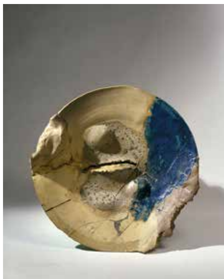
a sinistra/on the left: Peter Voulkos. Placa, 1962. Gres smaltato. Oakland Museum of California - Rocking Pot, 1956. Gres. Smithsonian American Art Museum / Peter Voulkos. Placa, 1962. Glazed stoneware. Oakland Museum of California - Rocking Pot,